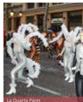
La Quarta Paret