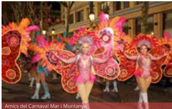
Amics del Carnaval Mar i Muntanya