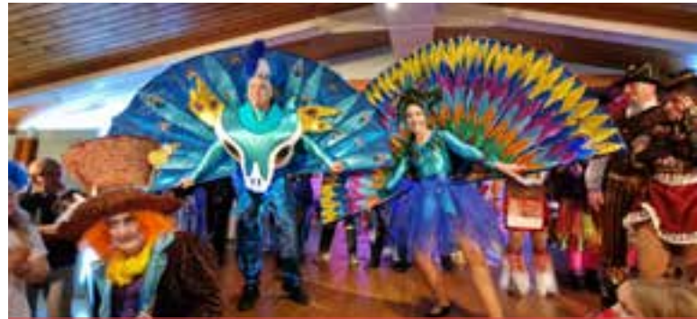
Una parella de la Santjoanenca exhibint la disfressa d'aquesta edició durant el Sopar de colles

El 2024 celebren 20 anys -en realitat, 20+1, però no compten el 2021, quan el coronavirus va impedir que les colles es reunissin per organitzar un nou carnaval-. Però lluny de pregonar el seu aniversari a tort i