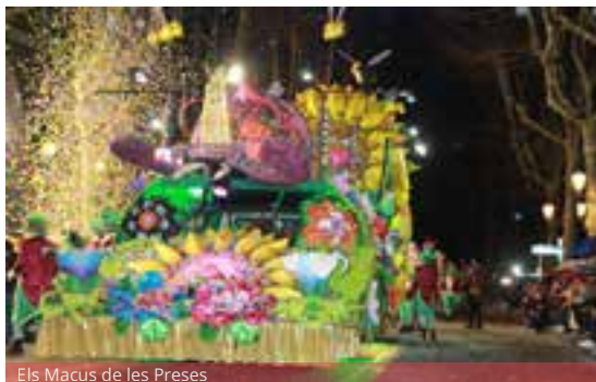
Els Macus de les Preses