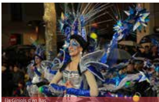
Els Gínjols d'en Bas