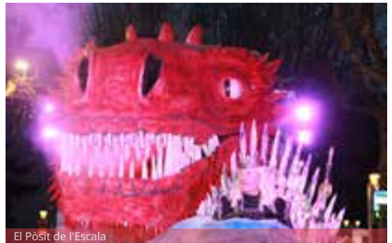
El Pòsit de l'Escala