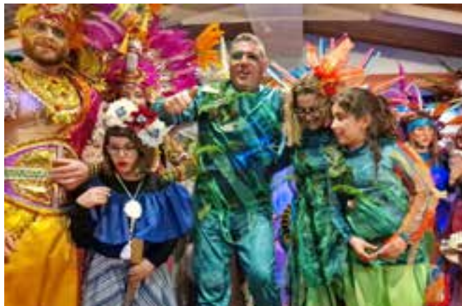
La disfressa de Els Marrinxos enguany combina amb la dels Reis del Carnaval

Un altre dels motius pels quals ens sentim molt orgullosos és per ser els portadors/es i els balladors/es de les Àligues de Sant Ferriol durant la festa del barri i a la Cercavila i el Seguici Popular de Festes i, darrerament, de la Gegantona Valèria, d'Integra, fet que demostra el tarannà inclusiu i cooperatiu que té la penya envers altres entitats de la ciutat. Ens els darrers anys, el nostre esperit inquiet i participatiu ens ha fet col·laborar també amb La Marató de TV3, organitzant una trobada de gegants pels carrers del nucli antic.