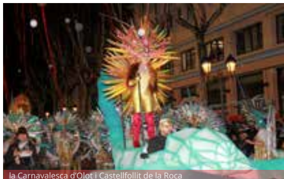
la Carnavalesca d'Olot i Castellfollit de la Roca