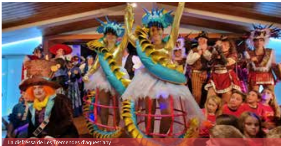
La disfressa de Les Tremendes d'aquest any

Nosaltres continuem aquí des dels inicis, que érem ben jovenetes. Som la segona generació. Però la bona notícia és que el futur pinta bé i gairebé ens atreviríem a dir que el tenim assegurat, perquè els nostres fills ja els tenim a la colla fent cosetes.