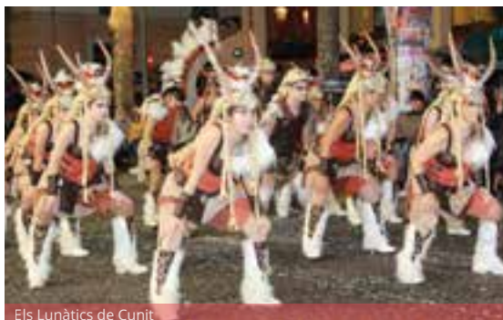
Els Lunàtics de Cunit